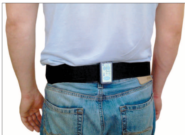
Рис. 1. Внешний вид обследуемого во время регистрации, на крестце фиксирован сенсор «Траст-М» (компания «Неврокор», г. Москва).

Это важно не только в клинических условиях, но и в бытовых. Стало возможным измерять количество движения, которое выполняет тот или иной человек в течение суток и более. Здесь имеется и прямой выход на клинические задачи – это объективная оценка количества физической нагрузки для пациента во время занятий ЛФК, бытовых действий, и т.д. Первые такие